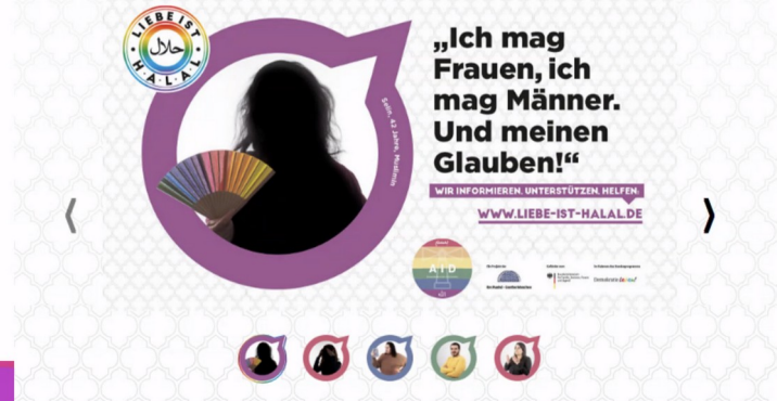
[Abbildung: Screenshot der Folie „Die Kampagne: Liebe ist halal“]

Liebe ist halal – deine, meine, unsere. Sexuelle Vielfalt wird von einigen gläubigen Muslimen als Sünde, als haram/verboten abgelehnt. Aber es gibt keine Rechtfertigung dafür, gleichberechtigte und aufrichtige Liebe zwischen zwei Menschen zu verbieten. Auch keine islamische. Egal, ob du Männer oder Frauen liebst, zu welchem Geschlecht du dich zugehörig fühlst oder wie du dich kleidest: Deine Liebe ist erlaubt. Diese Akzeptanz fordern wir mit der Kampagne ein und geben Liebe ein halal-Zertifikat.