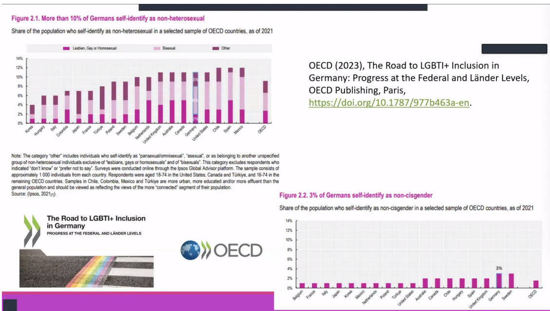
[Abbildung: Screenshot der Folie „The Road to LGBTI+ Inclusion in Germany (OECD)“ mit den Balkendiagrammen]